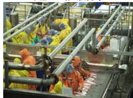
水産加工場 (択捉島)

一方、自然環境や気象条件が厳しいため、栽培される野菜の種類は少なく、生産の中心はジャガイモです。島内には農業企業は存在せず、生産の大部分は、「ダーチャ」と呼ばれる家庭菜園からの収穫です。