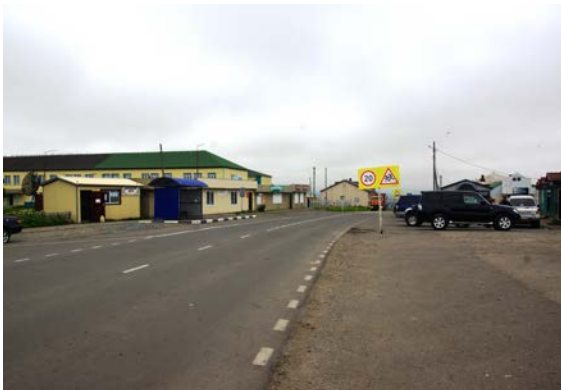
ふるかまっ ぶ 古釜 布の町並み（国後島）