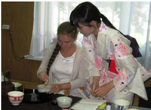
若者の交流（日本文化体験：色丹島）