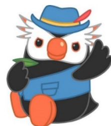
「エリカちゃん」のお友達の「エリオくん」