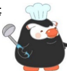
「エリカちゃん」のお友達の「エリマルくん」