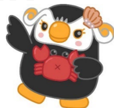
「エリカちゃん」のお友達の「エリナちゃん」

北方領土隣接地域※を訪問 する修学旅行を検討いただく ための、先生方を対象とした 下見ツアーです。