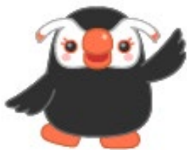
「エリカちゃん」 北方領土問題啓発キャラクター