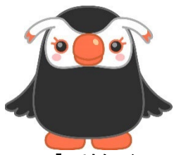
「エリカちゃん」 北方領土問題啓発キャラクター