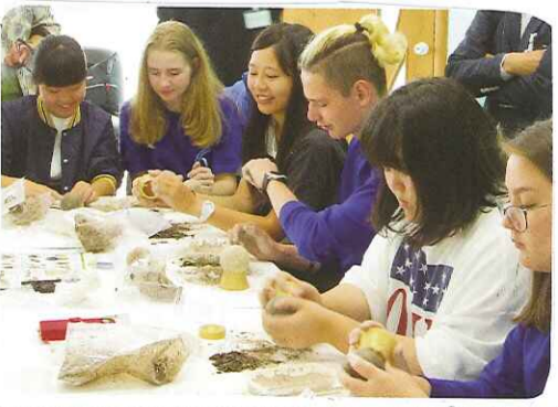
四島での住民交流会

私は今回北方領土問題にふれてみて、もっとたくさんの人にこのことを伝えたいと強く感じた。島民の方の話や、北方領土の映像を見て、今北方領土に住んでいるロシア人と日本人がどちらを納得するような考えを出すために、たくさんの人にこのことを考えて、よりよい解決入道についていきたいと思った。