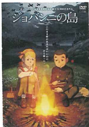
(元島民の方が モデルとなっている話)