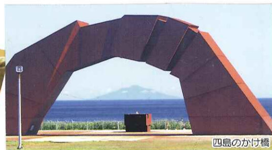
高さ 12.62m 長さ 35m 幅 3.4m ~ 5.0m

北方領土を4つのブロックに表現! 互いに連携し合って、大きなかけ橋と なり、領土返還を祈るゲートとして表現!