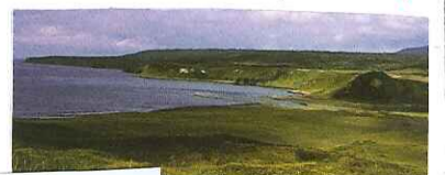
択捉島にはソ連軍はここから 上陸した。(択捉島留別村)

1945年(昭和20年)にソ連軍が 日本がポツダム宣言を受諾した後、 8月18日より千島列島への攻撃開始。 ウルップ島まで侵攻。 その後28日に択捉島、9月1~4日の間に 国後島、色丹島及び歯舞群島をそれぞれ 武装解除し、遅くとも9月5日までに 千島列島のみならず北方四島をも占領した とされている。そして、四島から日本人は 追い出され、現在はロシアによる現状の 占拠が続いている。