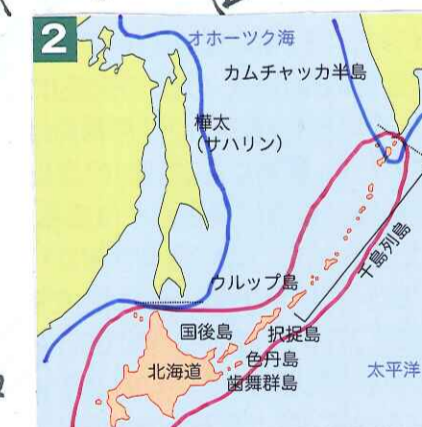
1805年樺太千島交換条約