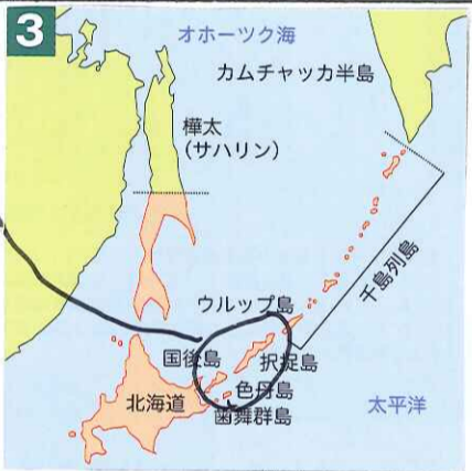
1905年ポーツマス条約 ↓ 46年後

約390年以上前、最上徳内、近藤重藏、高田屋嘉兵衛らが、島を発見。 北方領土を争う